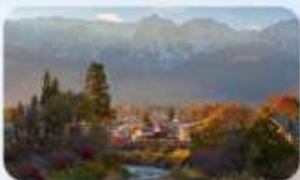
โออิเดะ ปาร์ค