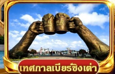
เทศกาลเบียร์ชิงเต่า