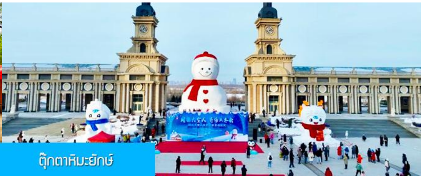
ตุ๊กตาหิมะยักษ์