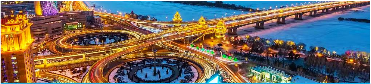
นครฮาร์บิน