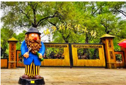
หมู่บ้านรัสเซีย

ชม หมู่บ้านรัสเซีย 俄罗斯小镇 ชมบ้านเรือนและรีสอร์ทสไตล์รัสเซียรวม 27 หลังภายในหมู่บ้านเล็ก ๆ แห่งนี้ ตั้งอยู่บนเกาะพระอาทิตย์ 位于太阳岛上 เมื่อนักท่องเที่ยวมาเยือนในหมู่บ้านเสมือนท่านกำลังเดินเล่นอยู่ในหมู่บ้านหนึ่งใน รัสเซีย