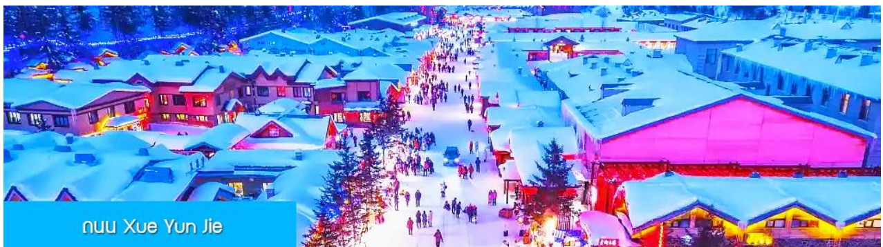
ถนน Xue Yun Jie