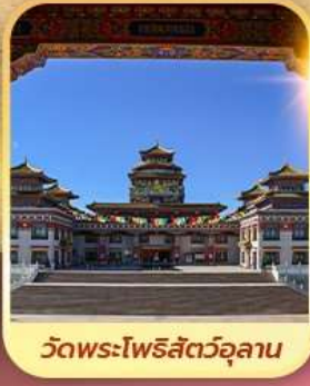
วัดพระโพธิสัตว์อูลาน