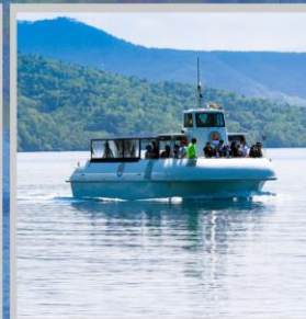
“LAKE SHIKOTSU GLASS BOAT”