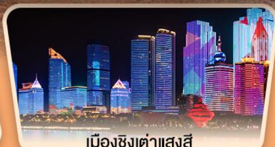
เมืองซิงต้าแสงสี