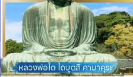
หลวงพ่อดโต โดบุตสึ คามาคุระ