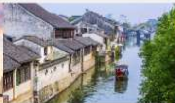
เมืองโบราณหนานซุน