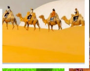
Optionกิจกรรม สันตนาการในทะเล ทราย