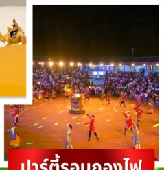
ปาร์ตี้รอบกองไฟ