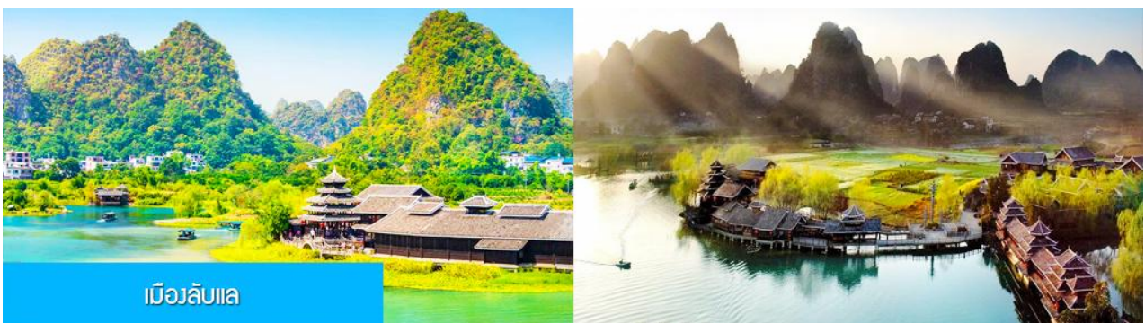
เมืองลับแล

พักที่ YANGSHUO ELITE GARDEN HOTEL ระดับ 4 ดาวท้องถิ่นหรือเทียบเท่าใน เมืองหยางชว่