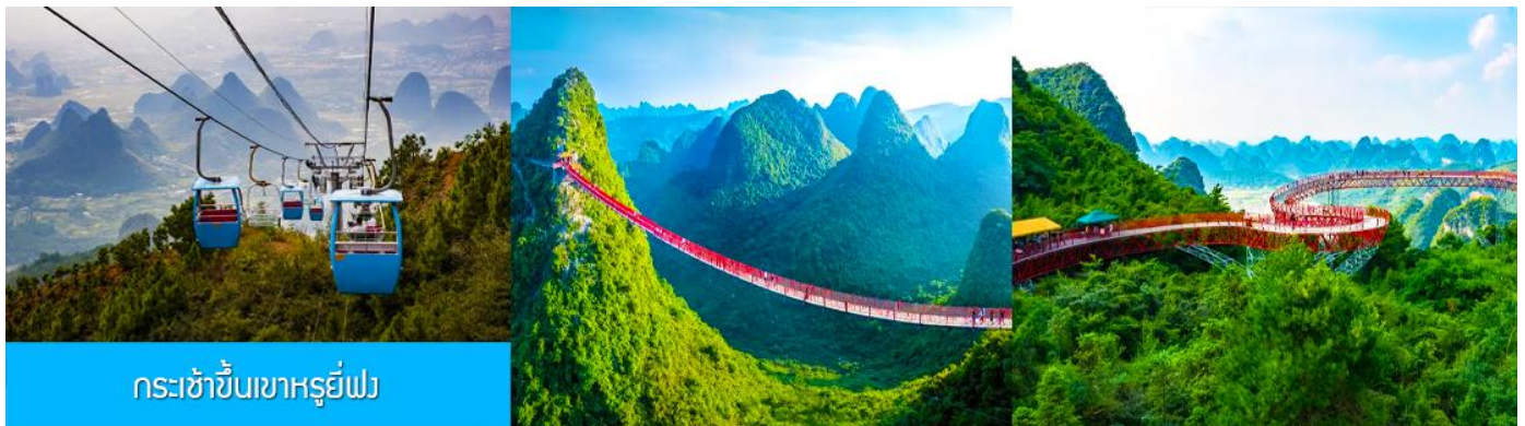
กระเช้าขึ้นเขาหรูยี่ฟง