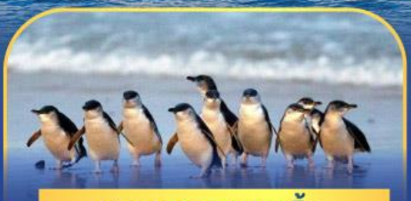
พาเหรดนกเพนกวิน