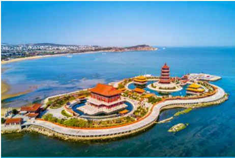
อุทยานทงเกี้ยวแปดเซียนข้ามทะเล