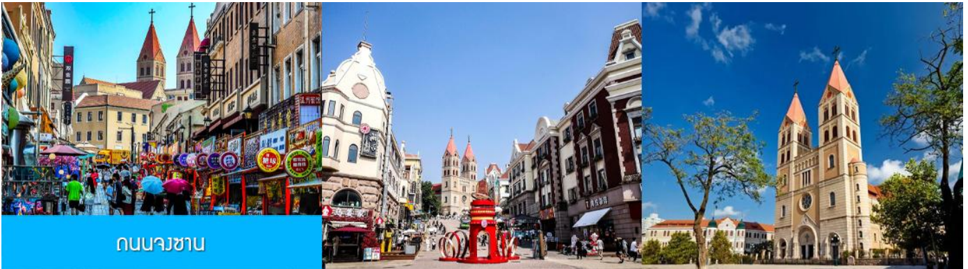
ถนนางซาน