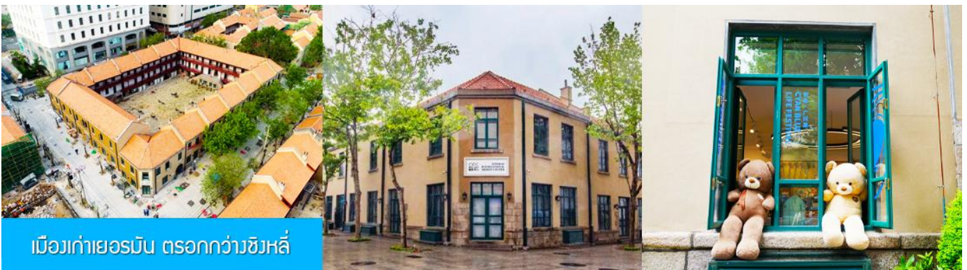
เมืองเก่าเยอรมัน ตรอกกว้างชิงหลี