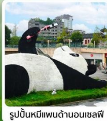
รูปปั้นหมีแพนด้าบนถนนเซฟิ