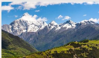
ภูเขาสี่ดรุณี (หุบเขาชวงเจียวโกว)