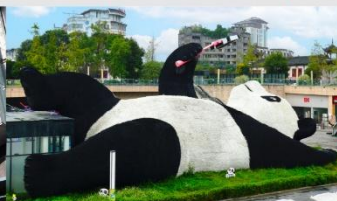
รูปปั้นหมีแพนด้าอนเซลฟี่