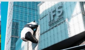
แพนด้ายักษ์ปีนตึก IFS