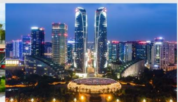
ตึกแฝดเจิงตู

*ทางบริษัทฯ ขอสงวนสิทธิ์ในการสลับโปรแกรมทัวร์ตามความเหมาะสมขึ้นอยู่กับสถานการณ์หน้างาน โดยคำนึงถึงผลประโยชน์ของลูกค้าเป็นสำคัญ