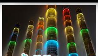
น้ำพุไม้ไผ่ตึกSKP