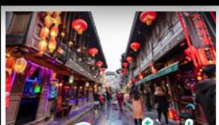
ถนนโบราณจิ่นหลี่