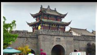
เมืองโบราณกวนเซี่ยน

ภูเขาสี่ตรุนี - อุทยานπί้นผิงโกว - สะพานหนานเฉียว - ร้านหนังสือจงซูเก้อ - เมืองโบราณกวนเสียน จตุรัสหย่าเทียนหวู่ - หมีแพนด้าเซลฟี - ถนนโบราณซอหยกวางซอหยกแคบ - ถนนคนเดินไท่กู่หลี่ ถนนคนเดินซุนซี - ถนนโบราณจิ่นหลี่ - แพนด้ายักษ์ปิงตึก - น้ำพุไม้ไผ่ตึกSKP - วัดต้าเฉียว