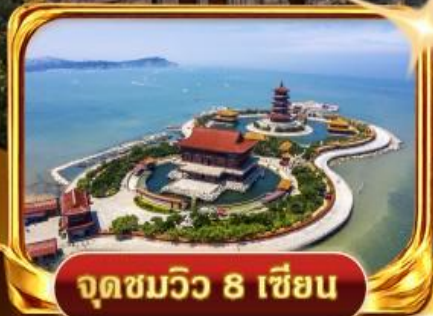
จุดชมวิวกว 8 เชียง