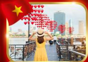
เช็กอินสะพานแห่งความรัก