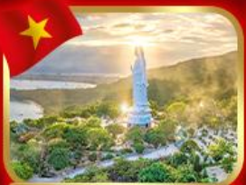
ขอพรกวอนอิม วัดหลินอึ้ง