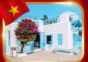
คาเฟ่สุดชิค ซานทรา มารีน่า