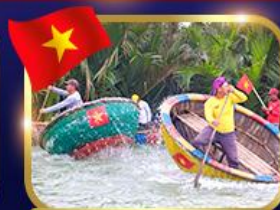
ล่องเรือกระดิว หมู่บ้านกัมบาน