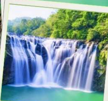
น้ำตกซือเฟิ่น