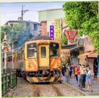
สถานีรถไฟซือเฟิ่น