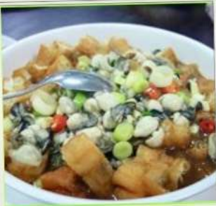
ถนนโบราณซือเฟิ่น