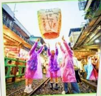
ปล่อยโคมลอย