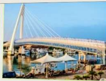
สะพานคู่รักตั้นสุ่ย