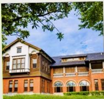
พิพิธภัณฑน์น้ำพุร้อนเป่ย์โถว