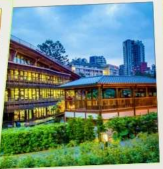
ห้องสมุดเป่ย์โถว