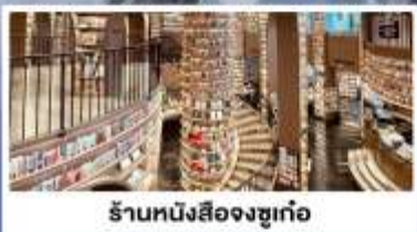
ร้านหนังสือจงซูเก้อ