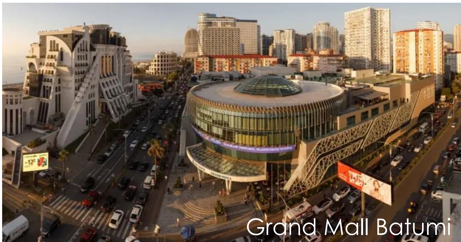
Grand Mall Batumi

ก่อนเดินทางกลับโรงแรม นำทุกท่านแวะช้อปปิ้งที่ Grand Mall Batumi ศูนย์การค้าขนาดใหญ่ของเมือง รวบรวมร้านค้าแบรนด์ดัง ร้านอาหาร และโซนบันเทิงมากมาย ก่อนให้ท่านได้อิสระช้อปปิ้งตามและรับประทานอาหารเช้าตามอัธยาศัย