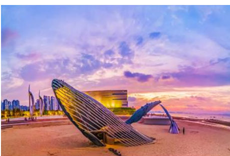
ประติมากรรม วาฬโดดเดี่ยว

จากนั้นนำท่านเดินทางสู่เมืองเยียนไถ 烟台 (ระยะทาง 72 กม. ใช้เวลาเดินทางราว 1 ชั่วโมง)