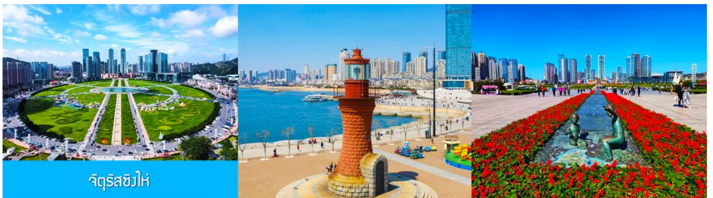
จัตุรัสซีไห่

จากนั้นนำท่านเที่ยวชมและเก็บภาพ ณ พิพิธภัณฑ์ประวัติศาสตร์หลี่ซุ่น 旅顺博物馆 เป็นอาคารพิพิธภัณฑ์เก่าแก่อายุกว่าร้อยปีแห่งแรกที่สร้างขึ้นทางภาคตะวันออกเฉียงเหนือของจีน อาคารพิพิธภัณฑ์มีความโดดเด่นด้วยสถาปัตยกรรมแบบกรีกโรมันยุคเรเนซองส์ ผสมผสานสถาปัตยกรรมแบบตะวันออก ภายในมีการจัดแสดงโบราณวัตถุกว่า 60,000 ชิ้น ท่านสามารถเก็บภาพที่ระลึกด้านหน้าอาคารพิพิธภัณฑ์ และสามารถเข้าชมโบราณวัตถุภายในพิพิธภัณฑ์ได้ตามอัธยาศัย (พิพิธภัณฑ์ปิดทุกวันจันทร์)..