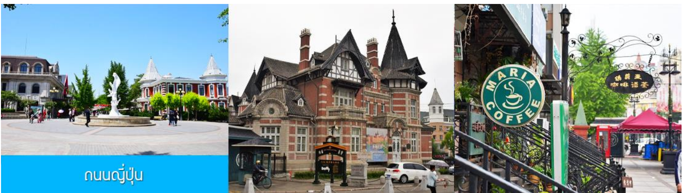
ถนนญี่ปุ่น