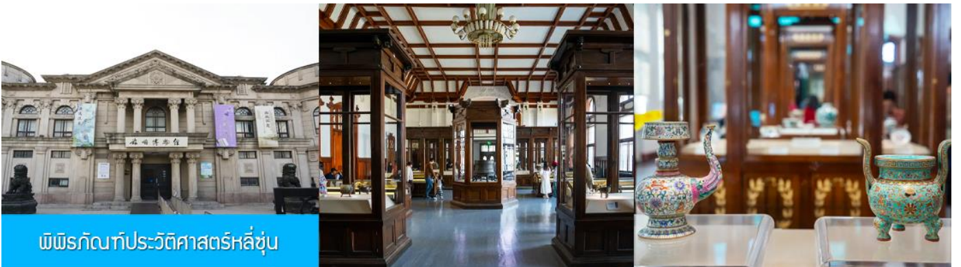
พิพิธภัณฑ์ประวัติศาสตร์หลี่ซุ่น

นำท่านเที่ยวชมและเก็บภาพ ณ สถานีรถไฟหลี่ซุ่น 旅顺火车站 เป็นสถานีปลายทางของเส้นทางรถไฟสาขา เลิ่นหยาง - ต้าเหลียน สร้างขึ้นในปีค.ศ. 1903 ออกแบบโดยสถาปนิกชาวรัสเซีย เป็นอาคารอิฐก่อปูนผสม โครงสร้างไม้ตามสถาปัตยกรรมรัสเซีย.