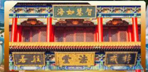
วัดจินไท่