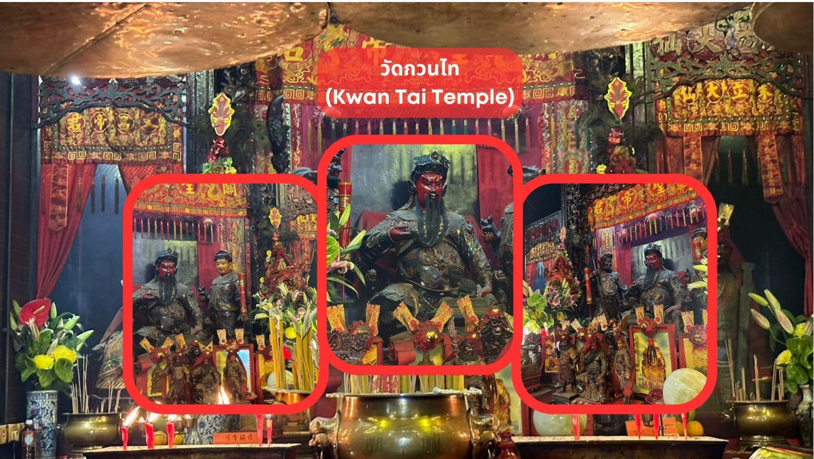
วัดกวนไท (Kwan Tai Temple)

รับประทานอาหารเช้า ณ ภัตตาคาร บริการท่านด้วยเมนูติ่มซำฮ่องกง (มื้อที่ 2)