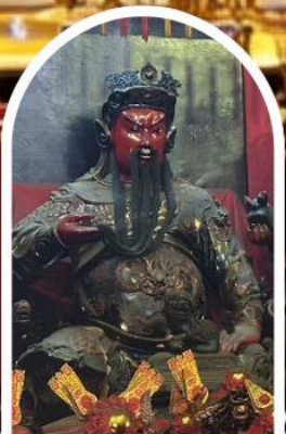
วัดกวนโถ

ขอเทพเจ้ากวนอู ความซื่อสัตย์ เงินทอง ธุรกิจมั่นคง