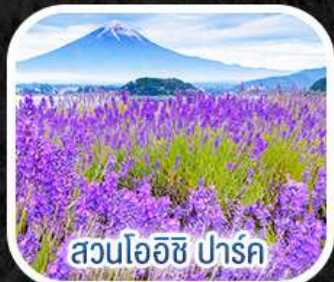
สวนโออิชิ ปาร์ค