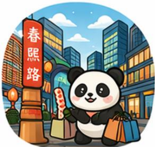
ถนนคนเดินชุนซีหลู่ (Chunxi Road)

จากนั้นอิสระท่าน ถนนคนเดินชุนซีหลู่ ย่านช้อปปิ้งชื่อดังและคึกคักที่สุดของเฉิงตู เต็มไปด้วยห้างสรรพสินค้า ร้านแบรนด์ดัง ร้านอาหาร และสตรีทฟู้ด เหมาะสำหรับช้อปปิ้งและสัมผัสวิถีชีวิตคนเมือง และ ถนนคนเดินไท่กู่หลี่ แหล่งช้อปปิ้งไลฟ์สไตล์สุดทันสมัย ผสมผสานสถาปัตยกรรมจีนโบราณกับดีไซน์โมเดิร์นอย่างลงตัว รายล้อมด้วยร้านค้าแบรนด์ดัง คาเฟ่ และมุมถ่ายรูปสวยๆ มากมาย