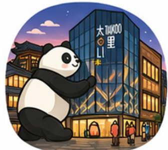
ถนนคนเดินไท่กู่หลี่ (Taikoo Li)

จากนั้นอิสระท่าน ถนนคนเดินชุนซีหลู่ ย่านช้อปปิ้งชื่อดังและคึกคักที่สุดของเฉิงตู เต็มไปด้วยห้างสรรพสินค้า ร้านแบรนด์ดัง ร้านอาหาร และสตรีทฟู้ด เหมาะสำหรับช้อปปิ้งและสัมผัสวิถีชีวิตคนเมือง และ ถนนคนเดินไท่กู่หลี่ แหล่งช้อปปิ้งไลฟ์สไตล์สุดทันสมัย ผสมผสานสถาปัตยกรรมจีนโบราณกับดีไซน์โมเดิร์นอย่างลงตัว รายล้อมด้วยร้านค้าแบรนด์ดัง คาเฟ่ และมุมถ่ายรูปสวยๆ มากมาย