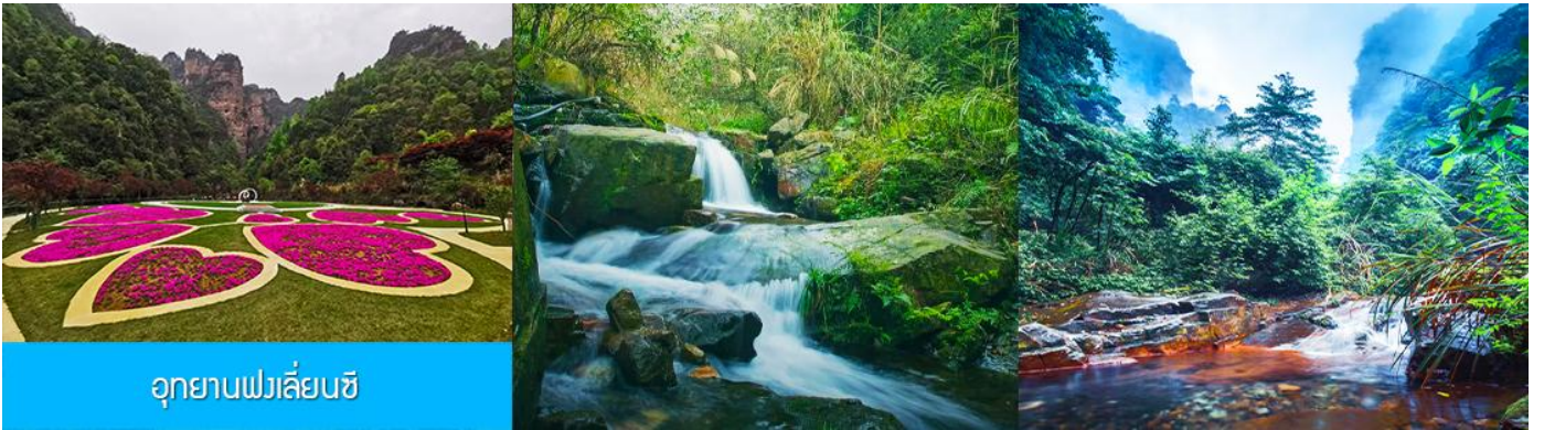
อุทยานฟงเลียนซี