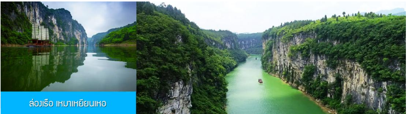
ล่องเรือ เหมาเหยียนเหอ