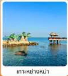
เกาะหย่างหม่า

ไฮไลท์...เที่ยวแดนมังกรฟิลยุโรป เมืองชายฝั่งทะเลเหลือง ชมสะพานจันเจียว และพิพิธภัณฑ์เบียร์