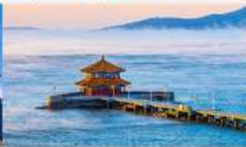
สะพานจันเจียว