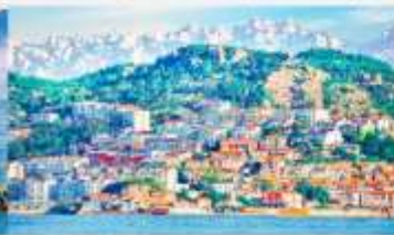
หมู่บ้านชาวประมงซาจื่อโซ่ว