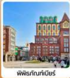
พิพิธภัณฑ์เบียร์