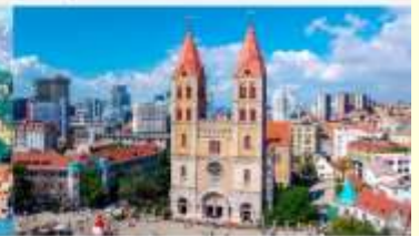
โบสถ์คริสต์เซนต์ไมเคิล

*ทางบริษัทฯ ขอสงวนสิทธิ์ในการสลับโปรแกรมทัวร์ตามความเหมาะสมขึ้นอยู่กับสถานการณ์หน้างาน โดยคำนึงถึงผลประโยชน์ของลูกค้าเป็นสำคัญ