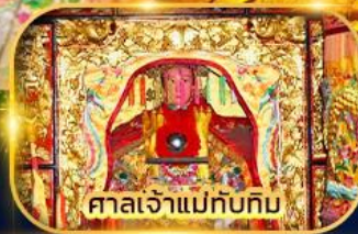
ศาลเจ้าแม่ทับทิม