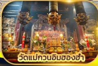
วัดแม่กวนอิมฮ่องฮ่า