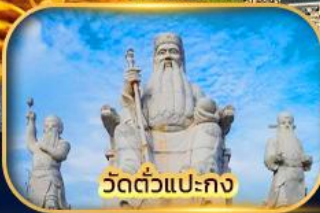
วัดตัวแปะกง