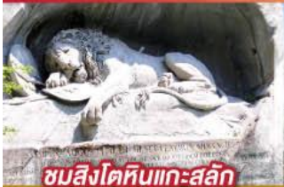
ชมสิงโตหินแกะสลัก