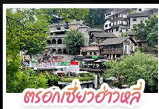
ตรอกเซียวฮ่าวเฉี