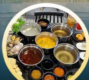
ชาบูฮ่องกง