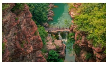
อุทยานสวรรค์หยุนโตซาน