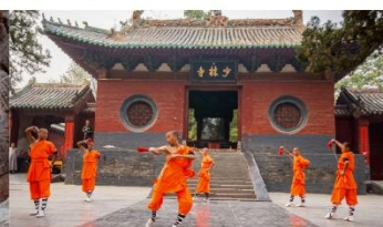
ชมโชว์กังฟูเส้าหลิน

*ทางบริษัทฯ ขอสงวนสิทธิ์ในการสลับโปรแกรมทัวร์ตามความเหมาะสมขึ้นอยู่กับสถานการณ์หน้างาน โดยคำนึงถึงผลประโยชน์ของลูกค้าเป็นสำคัญ