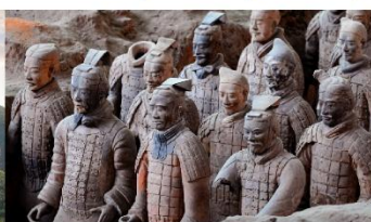
สุสานทหารจีนซี