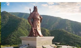
บ้านเกิดกวนอู