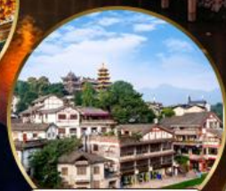
เมืองโบราณฉือจี้โข่ว