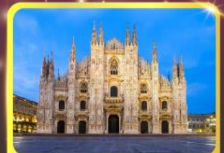
มหาวิหารแห่งเมืองมิลาน