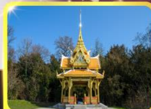
ศาลาไทยไชยานท์