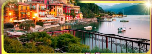
ทะเลสาบโลโบ