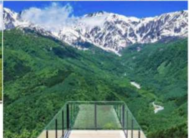
HAKUBA MOUNTAIN HARBOR THE CITY BAKERY