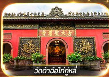
วัดต้าจื่อไท่กุหลี่