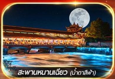
สะพานหนานเจียว (น้ำตาสีฟ้า)