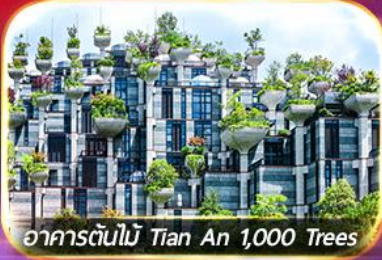
อาคารต้นไม้ Tian An 1,000 Trees