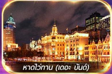
หาดว่อกาน (เดอะ บันด์)

เที่ยวดิสนีย์แลนด์เต็มวัน (รวมรถรับ-ส่ง)