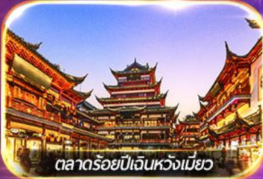
ตลาดร้อยปีเงินหวงเหมียว