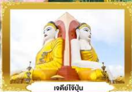
เจดีย์ไข่มุก