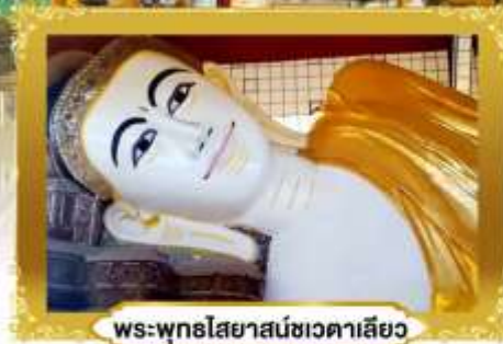
พระพุทธรูปไสยาสน์ชเวดากอง