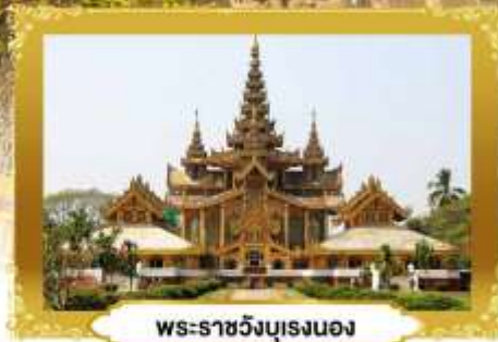
พระราชวังบุเรงนอง