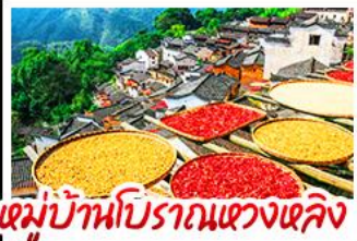
หมู่บ้านโบราณเขวงเหล็ก

- ภูเขาเทวดา "วังเซียนกุ" - หมู่บ้านโบราณหวงหลิง - กระจกท้องฟ้าหลิงซาน - แสงสีอู่หนี่โจว