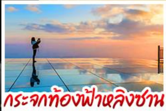
กระจกท้องฟ้าหลิงซาน