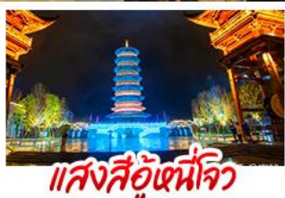
แสงสีอู่หนี่โจว