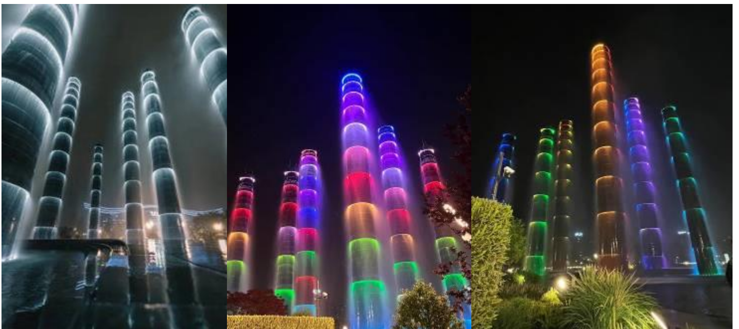
2UTFU-VZ003 เฉิงตู อุทยานสัตว์ถิ่น อุทยานปีศาจโกว อุทยานจิวจ้ายโกว (นั่งรถไฟความเร็วสูง) 6วัน 5คืน โดยสายการบิน Thai VietJet Air (VZ)