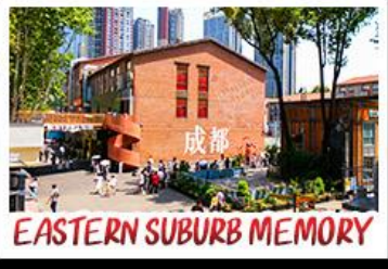
EASTERN SUBURB MEMORY