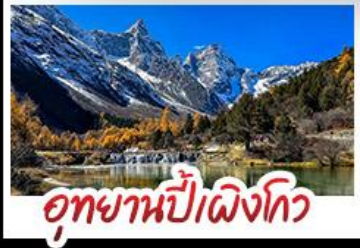
อุทยานปีแห่งทิว

อุทยานสี่ฤดู - อุทยานปีแห่งทิว - อุทยานจิวจ้ายทิว รถไฟความเร็วสูง - EASTERN SUBURB MEMORY ถนนโบราณความจำ - วัดต้าฉือ ช้อปปิ้งย่านต่ง ถนนไถ่กู่หลี่ + ถนนซุนซีลู่