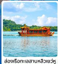
ล่องเรือทะเลสาบหลิวเยวู่