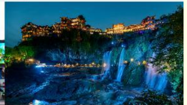
ฝูหรงเจิน

*ทางบริษัทฯ ขอสงวนสิทธิ์ในการสลับโปรแกรมทัวร์ตามความเหมาะสมขึ้นอยู่กับสถานการณ์หน้างาน โดยคำนึงถึงผลประโยชน์ของลูกค้าเป็นสำคัญ