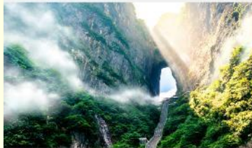
ประตูล้อมรั้ว