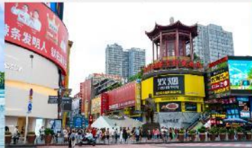
ถนนหวงซิงลู่