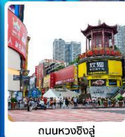
ถนนหวงซิงสู่

● ไอไลท์ เที่ยวสองเมือง จางซา จางเจียเจีย เชิคอินประตูสวรรค์ อุกยานเทียนเหมินซาน