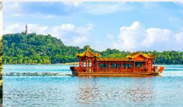
ล่องเรือทะเลสาบหลิวเยว่หู