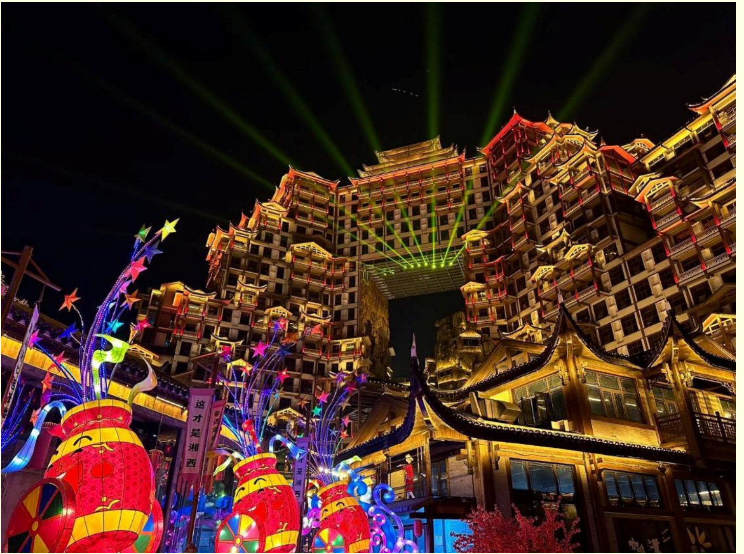
ที่พัก MELLOW CRYSTAL HOTEL โรงแรมระดับ 4 ดาว หรือเทียบเท่า