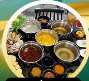
ชาบูฮ่องกง

03-05 มี.ค. 69 10-12 มี.ค. 69 04-06 มี.ค. 69 11-13 มี.ค. 69