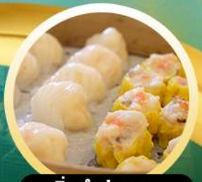
ติ่มซำฮ่องกง