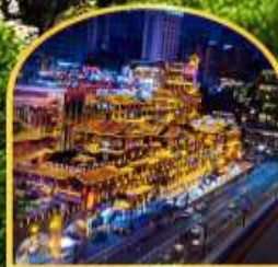
ตลาดหงษ์ต้ง