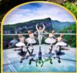
ระเบียงแก้วอุโมงค์