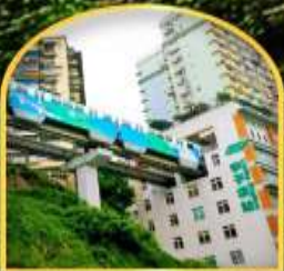
สถานีรถไฟชุกตัก