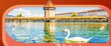
สะพานไม้ซังปก

Highlight เยือนหมู่บ้านแสนสวยเซอร์แมท เช็กอินศาลาไทยสุดงามที่โลซาน เที่ยวลูเซิร์น ชมสะพานไม้ซังและอนุสาวรีย์สิงโต ซาลี แอปลิน ชมประติมากรรม The Fork และปราสาทซิลลองริมทะเลสาบ เยือนมิลาน มหาวิหารดูโอโม เที่ยวเวนิส เมืองลอยน้ำสุดโรแมนติก อินกับรักอมตะที่บ้านจูเลียต และช้อปปิ้งจุใจที่ Serravalle Outlet