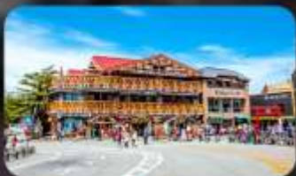
ฟูจิชั้น 5

INTERNATIONAL RESORT HOTEL YURAKUJO MARITA หรือเทียบเท่ามาตรฐานญี่ปุ่น