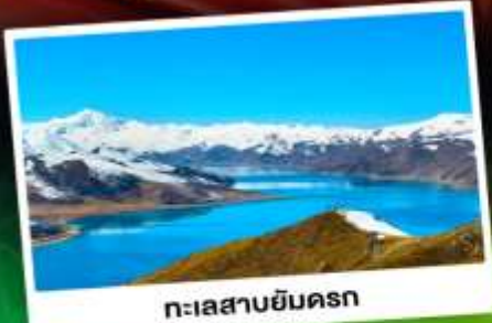
ทะเลสาบยัมดรก