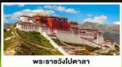
พระราชวังโปตาลา