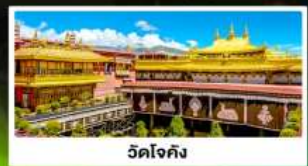
วัดโจกิง