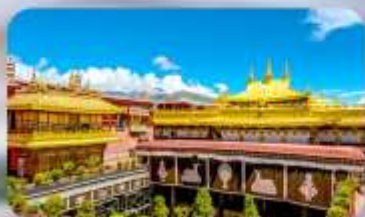
วัดโจกิง