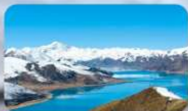
ทะเลสาบยิมครก