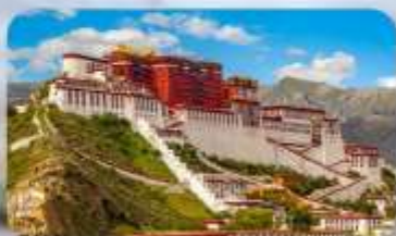
พระราชวังโปตาลา