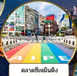
ตลาดซีเหมินติง