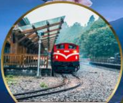
อุทยานอาลีซาน