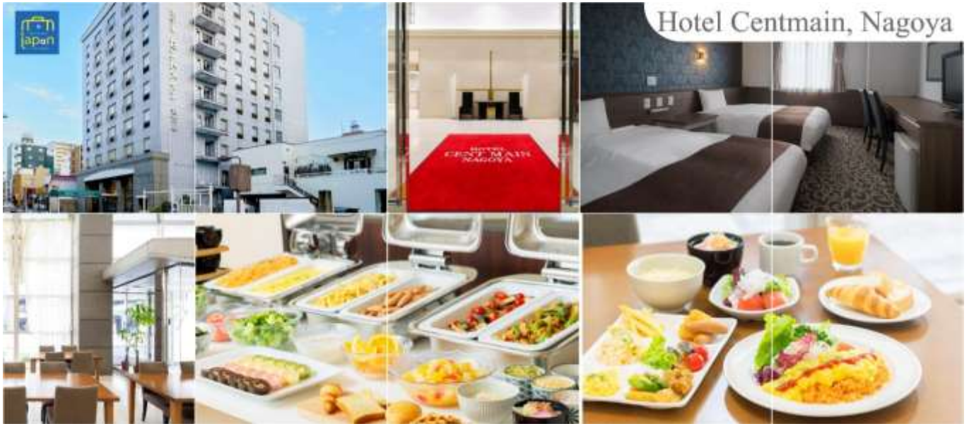
Hotel Centmain, Nagoya

วันที่สาม เมืองนาโกย่า – หมู่บ้านมรดกโลก ชิราคาวาโกะ – เมืองทาคายามะ – ถนนชั้นมาจิซุจิ – สะพานนาคะบาชิ – ที่ทำการเก่าเมืองทาคายามะ(ด้านนอก) – เมืองนาโกย่า