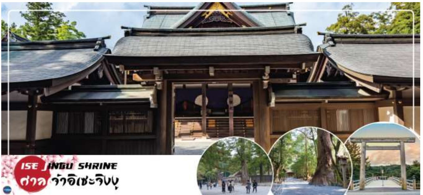
ISE JINGU SHRINE ศาลเจ้าอิเซะจิงกู

วันที่สอง จังหวัดมิเอะ – ศาลเจ้าอิเซะ – ถนนโบราณโอดาเงะ โยโกโซ – โชว์นินจา ณ สวนสนุก นินจาคิงดอมอิเซะ – เมืองนาโกย่า – แจ๊ซ ดริม เอ๊าท์เล็ท