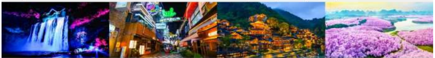
อุทยานน้ำตกหวงกั๋วซู่